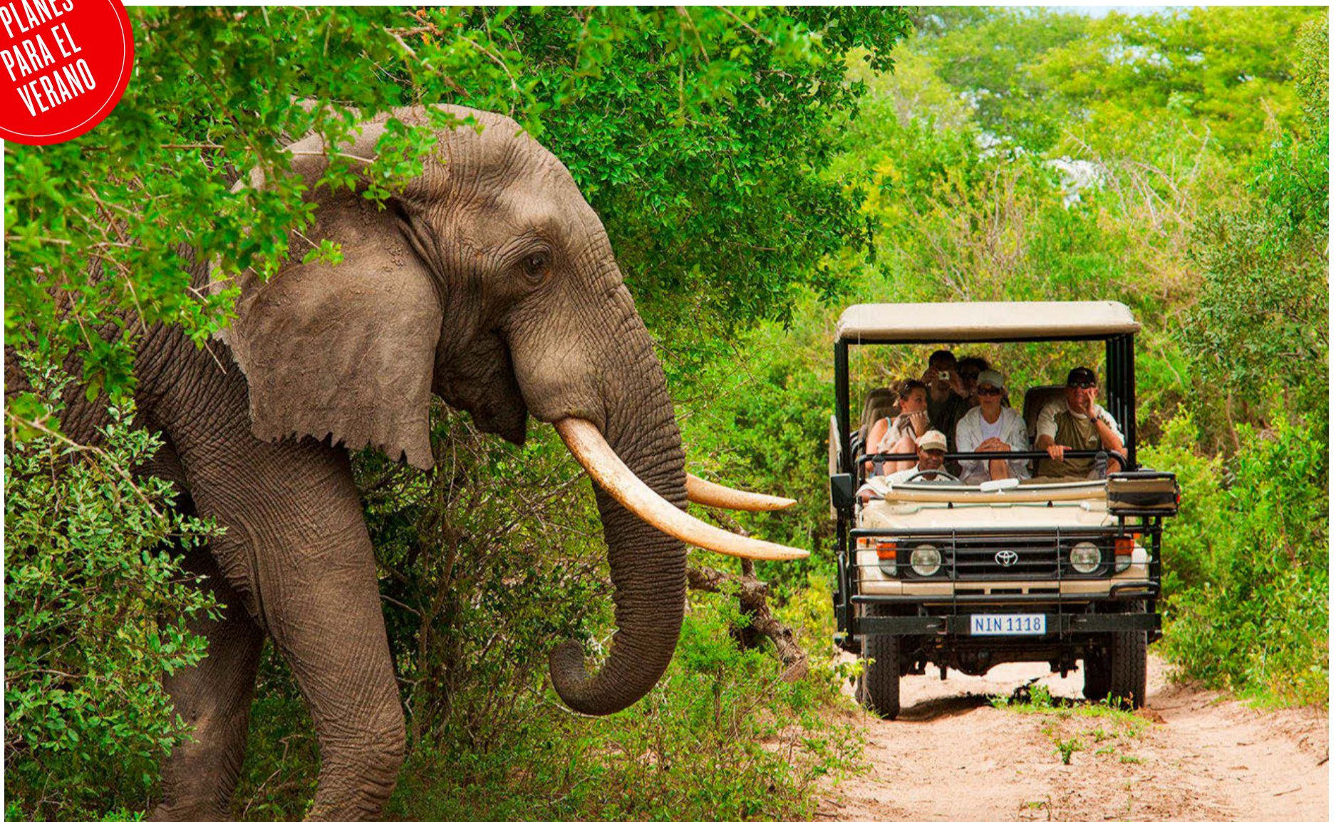
Un elegante se cruza frente a un grupo de turistas que disfruta de un safari guiado por el Parque Nacional Kruger de Sudáfrica a bordo de un todoterreno.

Hoteles rurales de lujo, un safari a la carta, un castillo en la Provenza, festivales callejeros y culinarios, el mejor 'resort' europeo de entretenimiento, un crucero por el Caribe... Estas propuestas buscan que nadie se quede en casa en verano