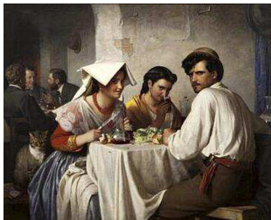
'In a Roman Ostería', de Bloch, 1866.

Esta muestra digital que combina barroco, impresionismo, simbolismo y realismo, nos permite explo-