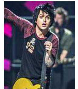
Green Day, en Sevilla el 2 de noviembre.

Green Day, uno de los grandes grupos de 'rock' de las últimas décadas, actuará en Sevilla el próximo sábado 2 de noviembre como cabeza de cartel del MTV World Stage Sevilla. Las entradas estará a la venta hoy a partir de las 11:00 horas y limitadas para el concierto a partir de las 11:00. El grupo ha estrenado nuevo single, Father Of All... que será título y tema principal de su próximo álbum de estudio que verá la luz el próximo febrero.