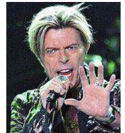
El documental 'David Bowie: finding fame' forma parte de La Mirada.