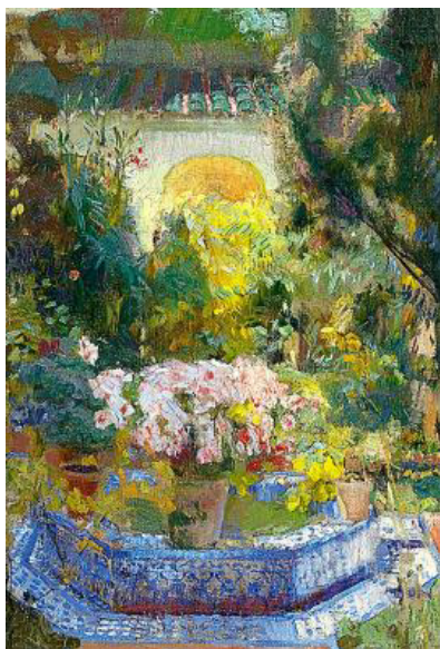
'Patio de la casa Sorolla' de Joaquín Sorolla, 1917.