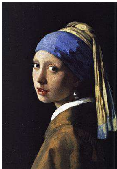
'La joven de la perla', de Vermeer, 1665.