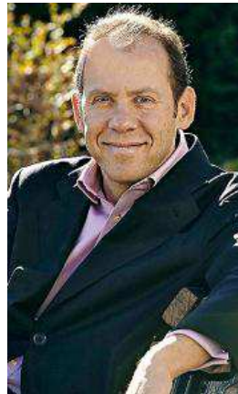
Ricardo Semler revolucionó a la empresa brasileña Semco dando la máxima flexibilidad a sus empleados.